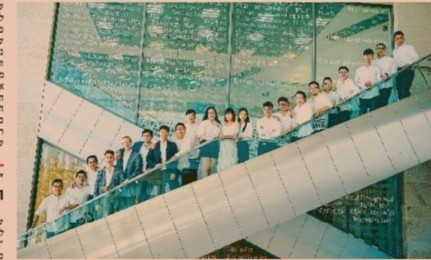
פיקוח: איציק זרוביץ/בצל/בצל (בנימין) | סטודנטים זרים בטכניון

בעקבות הפרסום בגלובס על הרפורמה המתוכננת להבאת אלפי עובדים זרים להייטק, התערורה מערה בענף • נציגי העובדים הוטרדים טוענים כי המהלך יפגע במתכנתים הצעירים • למרות הביקורת והעובדה שהתוכנית רק בוזתוליה, יש כבר חברות שמבקשות לעשות בה שימוש מיידי