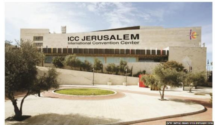
מרכז הקונגרסים בנייני האומה

https://www.kolhair.co.il/jerusalem-news/191407/