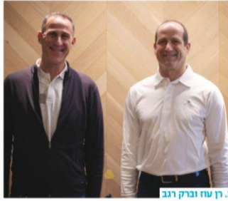
3. רח וברק רבב