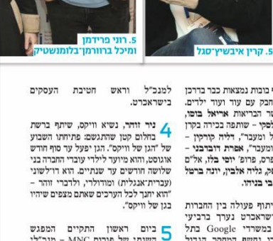
5. קרין איבשייטל

1. המגזן האגרי וובין מויה קיבל הטבעות את מיליית הכבוד המוחתבת של העיר מינכן, בחקירה על תרומתו להותה של מינכן "עיר המוזיקה". באירוע ניגנה לכבודו של משה הליהרמטוביץ של מינכן, בניצוחו של ליה שיר, שהלחין את משה כמנהל המוזיקלי של הליהרמטוביץ הישראלית והתמנה לאחריה כמנצח המיועד של הליהרמטוביץ של מינכן.